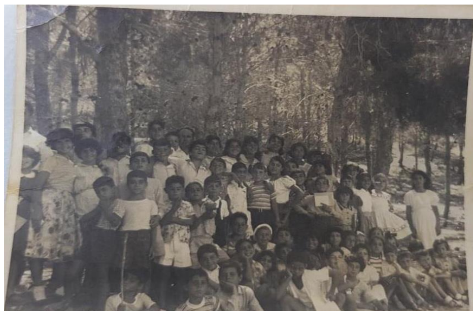
תמונה מבית הספר במעברה

בכיתה ה' העבירו אותנו ללמוד בביה"ס בקריית עמל. מדי יום, חורף וקיץ, היינו עולים ברגל את העלייה התלולה מהמעברה, דרך הוואדי עד לבית הספר וחוזרים כמובן ברגל. הופתעתי לגלות שאני קורא באופן רהוט ושוטף יותר מחלק מבני הכיתה הקירייתים מלידה... זאת בזכות הרצון וההוראה הטובה בבית הספר שבמעברה.